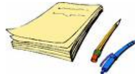
Des activités de pré-écriture et des jeux maison créés par les éducatrices